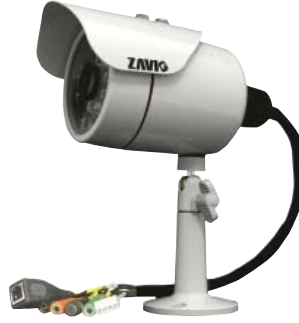
F531E VGA (640x480)