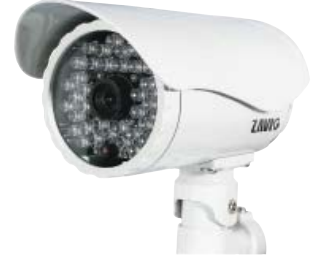
F731E VGA (640x480)