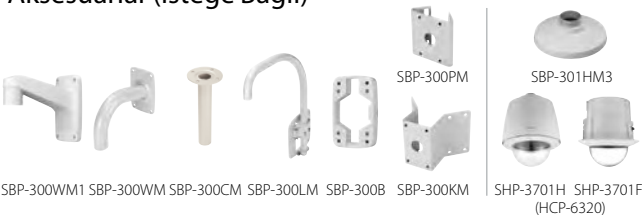
SBP-300WM1 SBP-300WM SBP-300CM SBP-300LM SBP-300B SBP-300KM SHP-3701H SHP-3701F (HCP-6320)