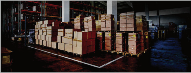
VIVOTEK SNV Kamera - Karanlıkta gerçek renkleri gösterir.