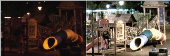
Sıradan Bir Kamera