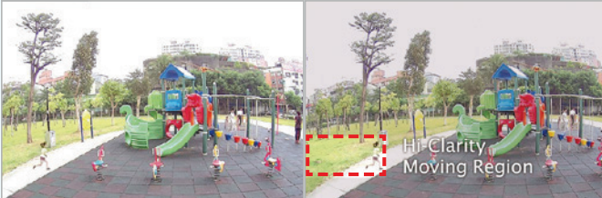
Akıllı Akım II Olmadan