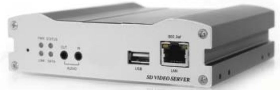
TCS-300 D1 (720 x 576)