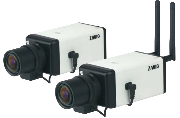
F7110 1.3Mp (1280x1024)