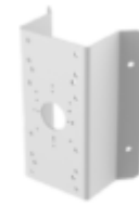
DS-1276ZJ-SUS Corner Mount